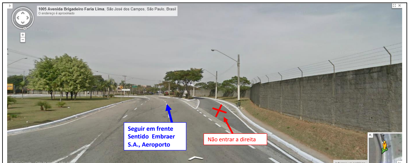
Fig. 04 - Trecho próximo a chegada à Embraer. Seguir em frente e após a curva existe uma reta que leva a rotatória em frente a Embraer (esta é a rotatória mostrada na parte superior direita do mapa acima (Fig. 03)).