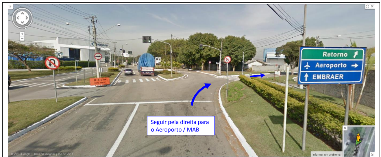
Fig. 05 - Rotatória em frente à Embraer (ver Fig. 03, logo acima do logotipo da Embraer). As equipes devem virar à direita e seguir em frente na direção do Aeroporto. Após uma reta chegase no local mostrado na foto a seguir (Fig. 06).