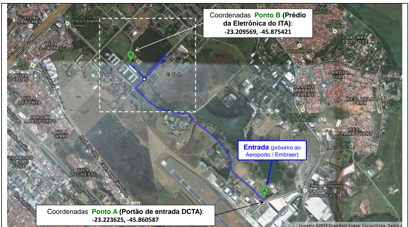
Fig. 08 - Caminho completo por dentro do DCTA para se chegar aos prédios do ITA onde ocorrem as Apresentações Orais, Showroom das Aeronaves e Cerimônia de Abertura. Para se chegar a estes locais, deve se fazer o contorno conforme indicado na figura abaixo (dentro do retângulo tracejado branco) fazendo um retorno na rotatória e voltar na direção do Prédio da Eletrônica do ITA ou se possível, usar a conversão a direita mostrada na Fig. 09.