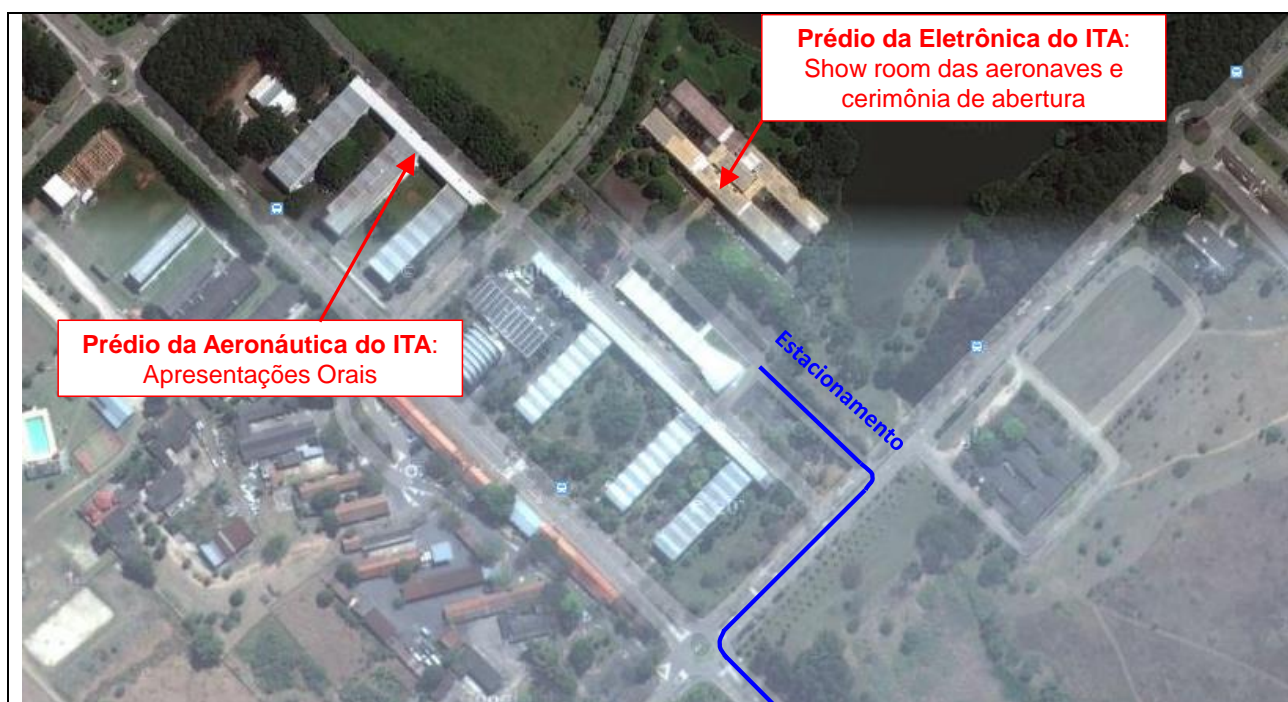
Fig. 09 - A figura acima detalha outro trajeto para se chegar aos prédios do ITA via conversão à direita. Um possível estacionamento para os ônibus e vans das equipes poderá ser na área gramada à direita desta entrada. Este estacionamento ainda está em estudo.

Prédios do ITA onde ocorrem os principais eventos do SAE AeroDesign (Apresentações Orais, Showroom das aeronaves e Cerimônia de Abertura)