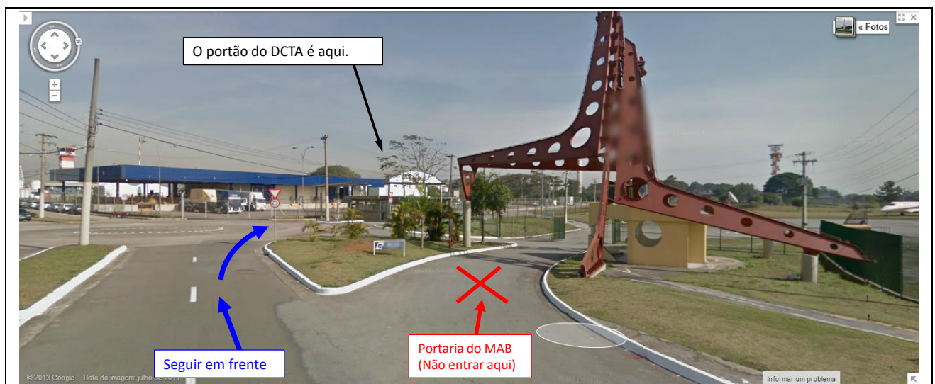
Fig. 06 - Ponto próximo a entrada do MAB (Memorial Aeroespacial Brasileiro). O portão de entrada para o DCTA encontra-se na segunda bifurcação a direita após a entrada do MAB. Não virar na direção do MAB (portal de estrutura metálica).