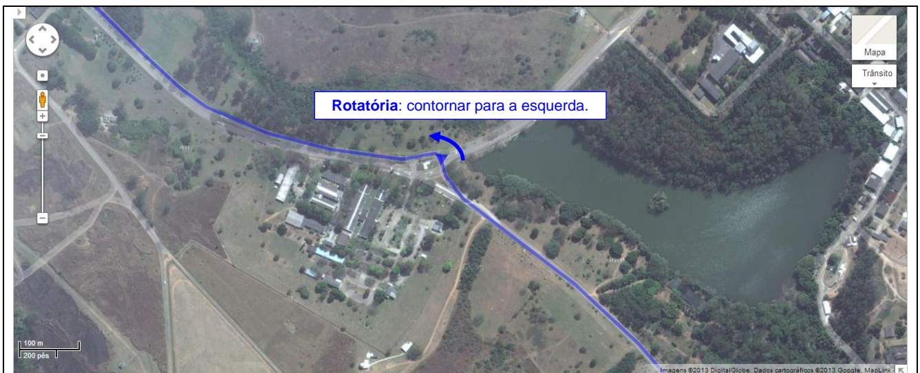
Fig. 07 - Após o portão de entrada e da identificação das equipes, seguindo por dentro do DCTA na via principal de ligação do portão aos prédios do ITA, existe uma rotatória. Os veículos devem passar por esta rotatória contornando à esquerda e seguindo-se em frente, na mesma via.